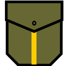
ВІДЗНАКА ЧЛЕНА КУРІННОГО ПРОВОДУ