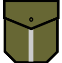
ВІДЗНАКА ЗАСТУПНИКА ГУРТКОВОГО