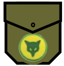
ВІДЗНАКА ДІЮЧОГО НОВАЦЬКОГО ВПОРЯДНИКА (в додатку до білого шнурка до свистка)